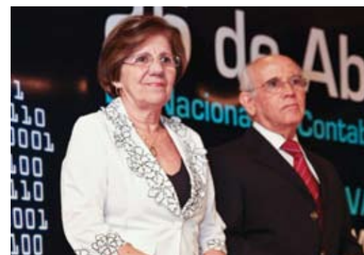
Dia Nacional do Contabilista do CRC-PE

Para fechar o dia com chave de ouro, uma bela festa foi realizada, também na sede, com direito à feijoada, torneio de dominó e muito reconhecimento.