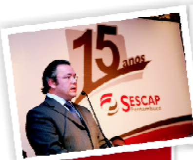
15 anos do Sescap-Pernambuco.

Representar suas associadas e zelar por seu desenvolvimento – Dentro dessa filosofia de trabalho, o “Fator S” do SESCAP-Pernambuco, mote das comemorações de 15 anos, foi um aglutinador de forças e projetou as bases para um 2009 mais fortalecido.