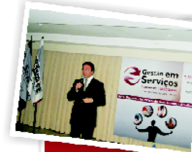
Gestão de Serviços 2008: palestra sobre SPED - Tecnologia para Reduzir Custos.