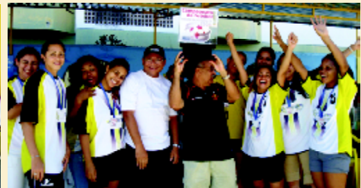
Campeão feminino: ASSCONTA