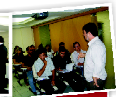
Curso Prodepe no auditório do SESCAP-Pernambuco.