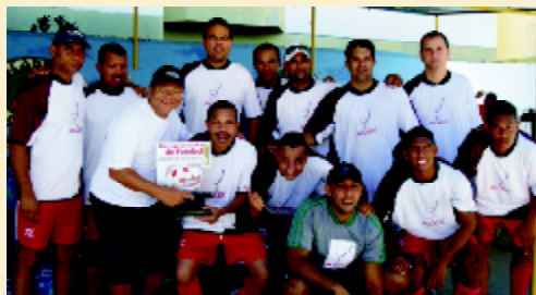
Campeão masculino: ALEC

Mais uma vez as empresas associadas ao sindicato vestram a camisa da integração e entraram em campo para mais um Campeonato de Futebol SESCAP-PE/AESCON-PE. Mantendo a tradição, a disputa pelo título masculino e feminino deste ano foi acirrada, deixando um saldo de 138 gols em 26 partidas. Os grandes campeões foram ALEC (masculino) e ASSCONTA (feminino) que fizeram a festa e deram um show de competitividade e espírito esportivo. O SESCAP agradece a participação de todos e garante que em 2009 tem mais.