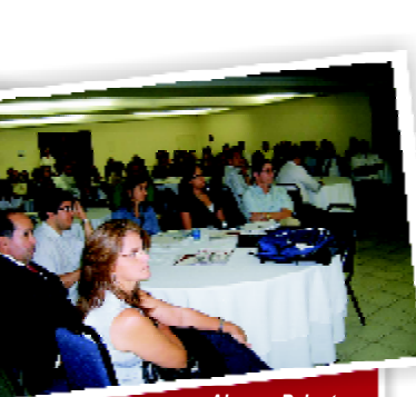
Almoço Palestra Nota Fiscal Eletrônica.