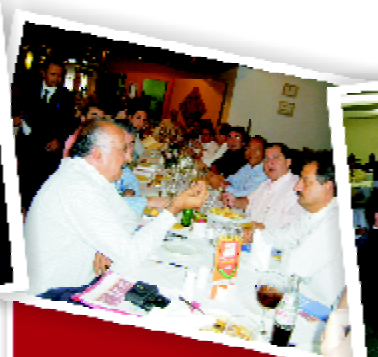
Almoço informal - 26.11.08.