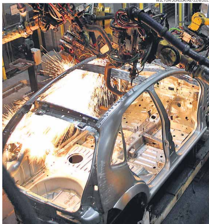
Sem energia. Nem o fim do ano anima o segmento industrial

"Os indicadores de outubro mostram um cenário negativo para a indústria. A atividade está desaquecida, a produção caiu e os estoques de produtos finais aumentaram", afirmaram os técnicos da entidade na pesquisa, divulgada ontem, que ouviu 1.864 empresas.